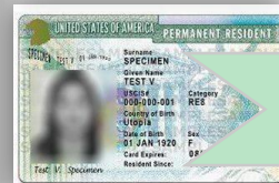
«Грин карта» США