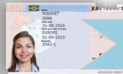
«Голубая карта» ЕС